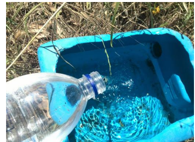
Bak met water