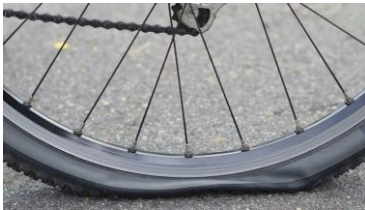
Een fietswiel met platte band