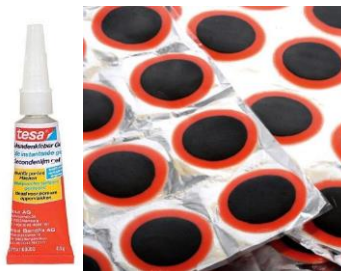
Lijm en plakkers