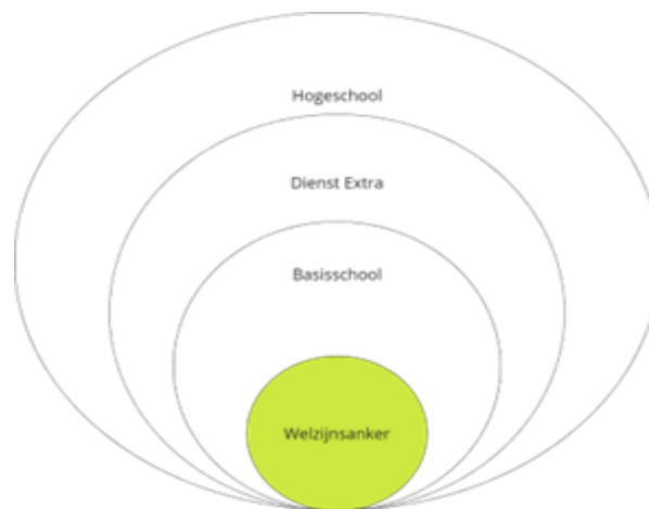
Figuur 3 - drievoudige ondersteuning van de welzijnsankers

Het Welzijnsanker werkt in de eerste plaats in de basisschool , met de zorgcoördinatoren als stagementoren . Ze zijn de voornaamste steunfiguren van de welzijnsankers en ondersteunen hen op dagelijkse basis: aanmeldingen doorgeven, hun vragen te beantwoorden, hen wegwijs te maken in de school en het bredere netwerk aan organisaties in de wijk. De zorgcoördinatoren evalueren studenten vooral op niveau van het dagelijkse functioneren, de samenwerking met het schoolteam, hoe men contact maakt met ouders en het werkplekleren op de school: